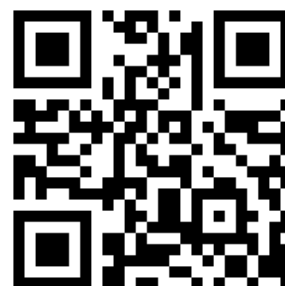
質問受付アドレス QR コード

質問：本総会資料について質問のある方は、 右記 QR コードを読み取り、 指定の質問受付アドレスまで 4 / 6 までにメールにて 送信ください。